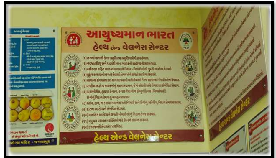
12 service package at AAM-SHC